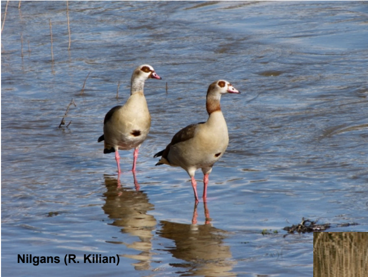
Nilgans (R. Killian)