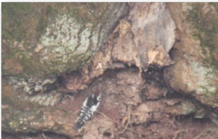
Ein Mittelspecht vor dem Naturparkzentrum Stromberg (Dietmar Gretter)

Mittelspecht: 1 M 18.8.10 NP Zentrum,Zaberfeld,HN (D.Gretter)