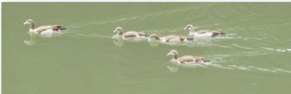
Nilgans mit drei juv (Junge) in Lauffen/N. (Jürgen Hellgardt)

Nilgans: 2 Ind. 08.8.10 Schleuse, Horkheim, HN (J.Fischer) 2 Ind. 20.8.10 Nordheim, HN (J.Fischer)