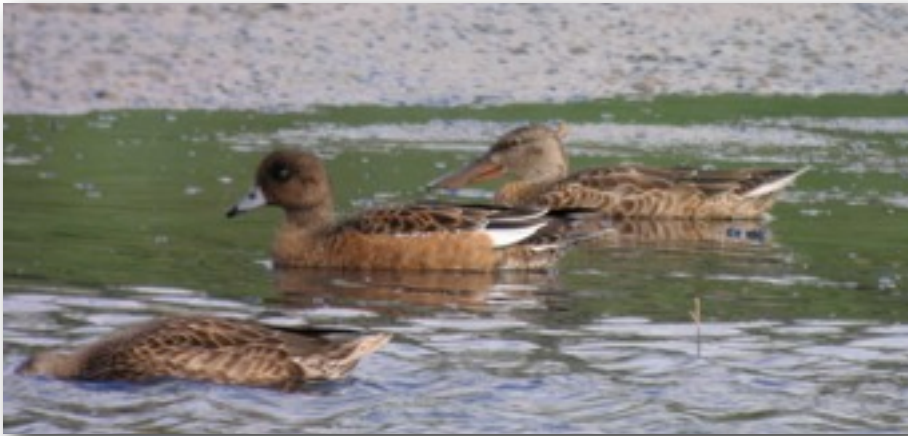
Pfeifente begleitet von einer Löffelente (Jochen Fischer)

Pfeifente: 1 W 29.8.10 Klärteiche Offenau,HN (J.Fischer)