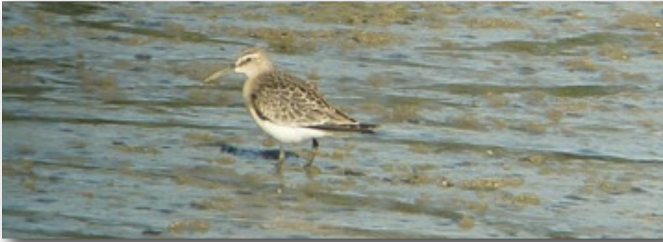
Ein seltener Gast im Unterland: Sichelstrandläufer (M.u.E. Graf)

Lachmöwe: 3 Ind. 01.8.10 Klärteiche Offenau,HN (R.Gramlich,J.Fischer,E.Mayer) 8 Ind. 08.8.10 Schleuse,Horkheim,HN (J.Fischer) 2 Ind. 15.8.10 Ehmetsklinge,Zaberfeld,HN (J.Fischer) 3 Ind. 29.8.10 Klärteiche Offenau,HN (J.Fischer)