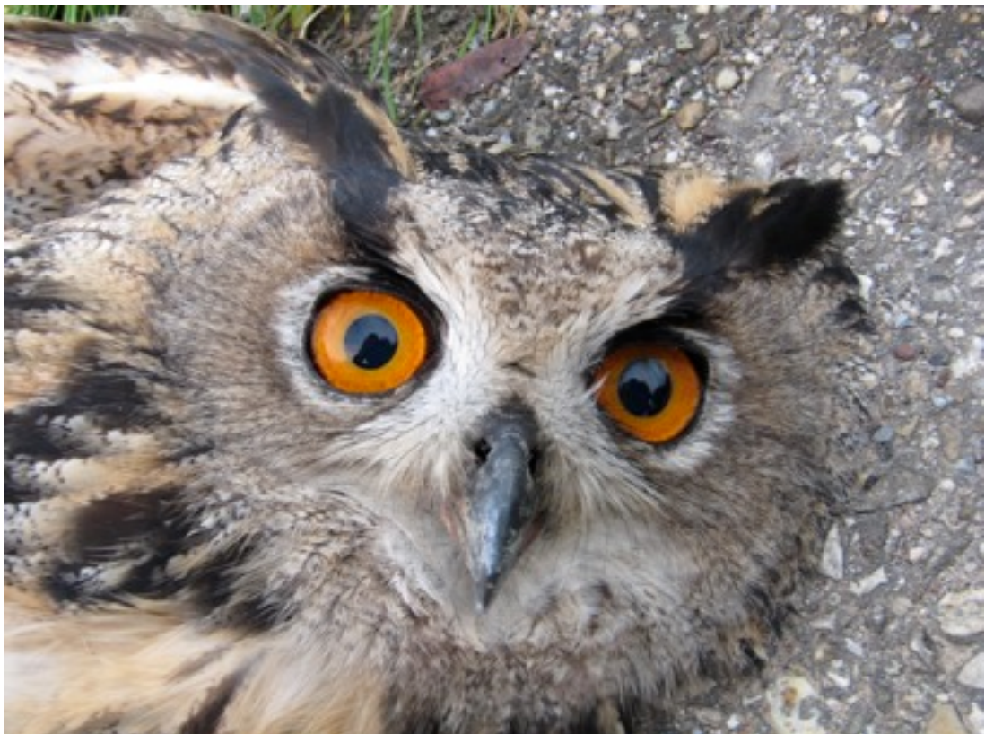
Ein Uhu! Bedauerlicherweise wurde dieser Großvogel Opfer des Straßenverkehrs. Erstaunlicherweise hatte dieser Uhu nur einen Fuß.