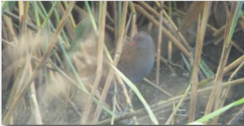
Eine Wasserralle am Rande des Schilfröhrichts (Ann-Marie Ackermann)

Wasserralle: 1 Ind. 15.8.10 Klärteiche,Offenau,HN (E.Geiger, P.Haag, M.Wieland) 1 Ind. 29.8.10 Klärteiche,Offenau,HN (A.M.Ackermann) 1 Ind. 31.8.10 Stebbacher Wiese,Epp.,HN (R.Gramlich,J.Fischer)