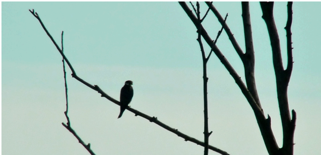
Ein Baumfalke wartet im NSG Zaberauen in Meimsheim auf Beute. Später rupfte der Baumfalke eine Mehlschwalbe.