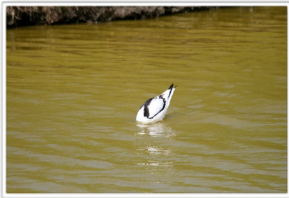
Ein Rätselvogel steckt den Kopf unter Wasser. Um welche Limikole handelt es sich.