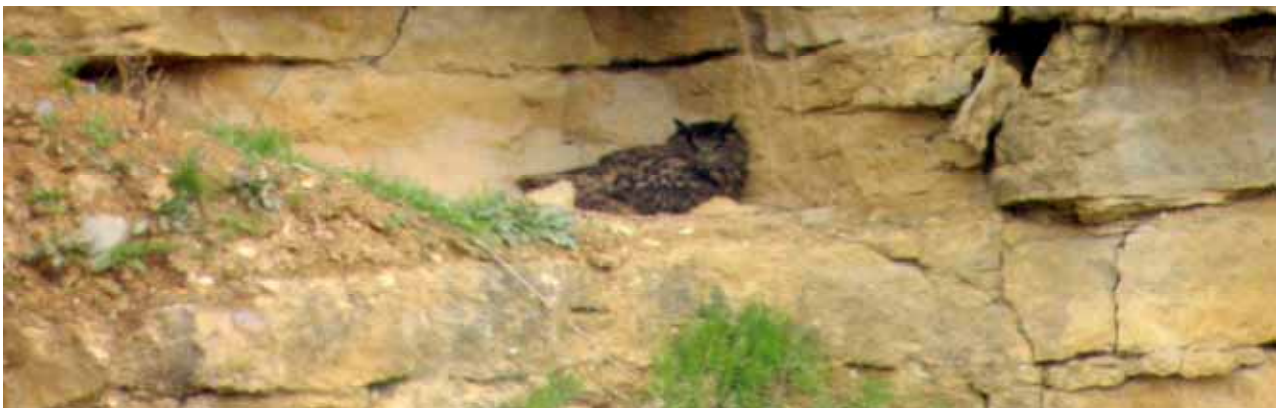
Vogelrätsel!? Um welche Vogelart handelt es sich? Und was macht der Vogel dort?

Beobachtungen und bei Interesse, per Mail an: oaghn@web.de oder an ornischule@web.de